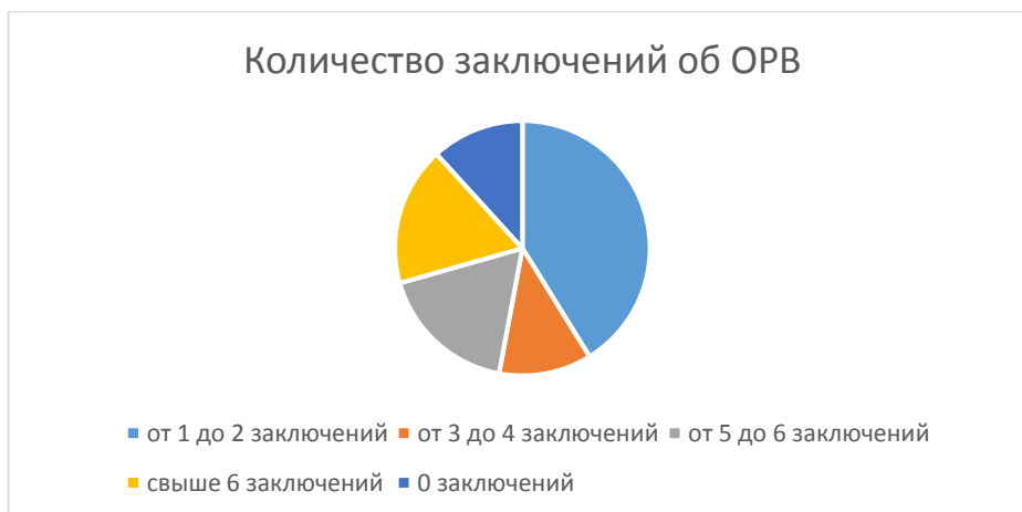
Рисунок 1 – Количество заключений об ОРВ

В 2019 году подготовлено более 120 заключений об ОРВ (рис. 1) и 98 заключений об экспертизе (рис. 2).