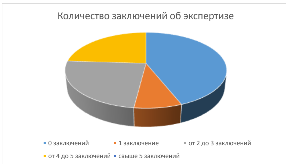
Рисунок 2 – количество заключений об экспертизе

Незначительное сокращение числа проведенных оценок связано с действием ограничительных мер в связи с распространением новой коронавирусной инфекции (Covid-19) и, как следствие, снижение количества, разрабатываемых муниципальных НПА.