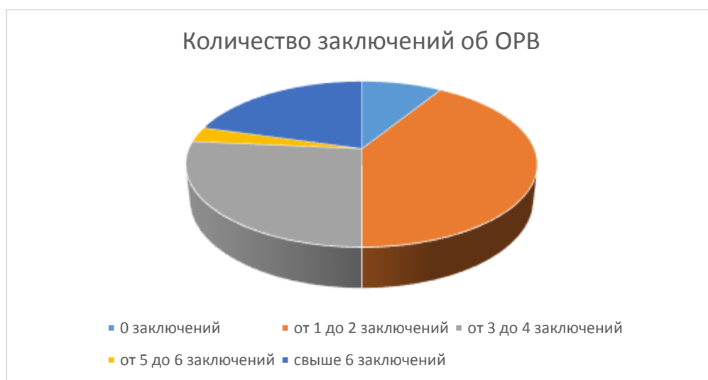
Рисунок 1 – количество заключений об ОРВ

За 2020 год подготовлено 116 заключений об ОРВ (рис. 1) и 140 заключений об экспертизе (рис. 2).