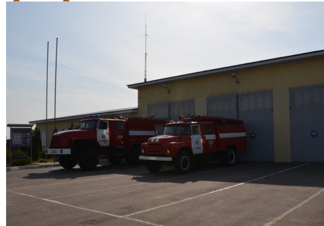
Пожарная часть с. Губарево 26 млн. руб.

Муниципально-частное партнерство - юридическое оформление на определённый срок и основанное на объединении ресурсов, распределении рисков сотрудничества публичного партнера, с одной стороны, и частного с другой стороны, которое осуществляется на основании соглашения о МЧП в целях привлечения в экономику частных инвестиций, обеспечения органами государственной власти и органами местного самоуправления доступности товаров, работ, услуг и повышения их качества.