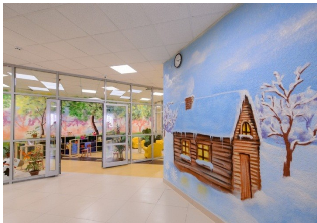
Детский сад «УМКА» с. Девица 148 млн. руб.