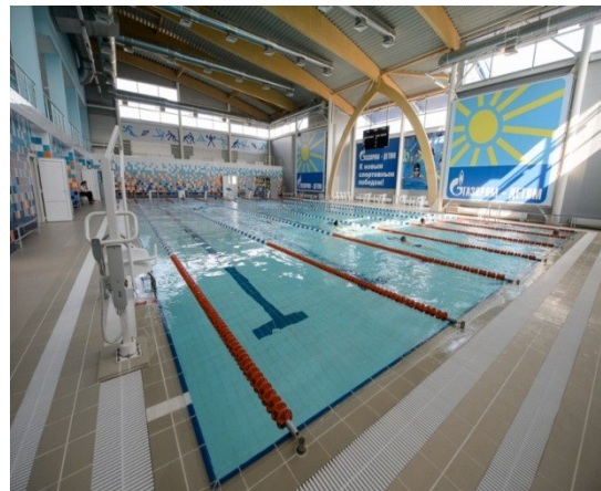
ФОК «Аквамарин» г. Семилуки 481 млн. руб.